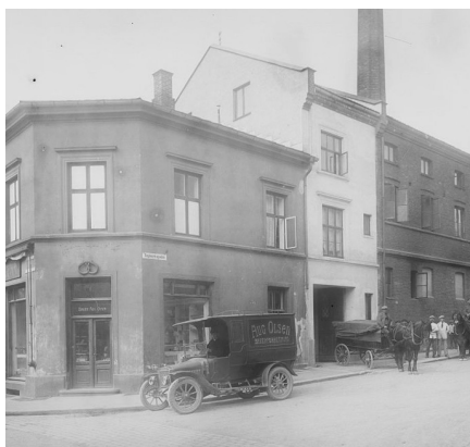
Bageri i Oslo i begyndelsen af 1900tallet

Thorbjørn Egner voksede op i et arbejderkvarter i Oslo, hvor hans forældre havde en lille købmandsbutik. Kvarteret minder meget om Kardemomme By. Ved siden af forældrenes købmandsbutik lå en slagter og en bager. Det er derfor næppe et tilfælde, at det netop er købmanden, slagteren og bageren, der fanger røverne i historien.