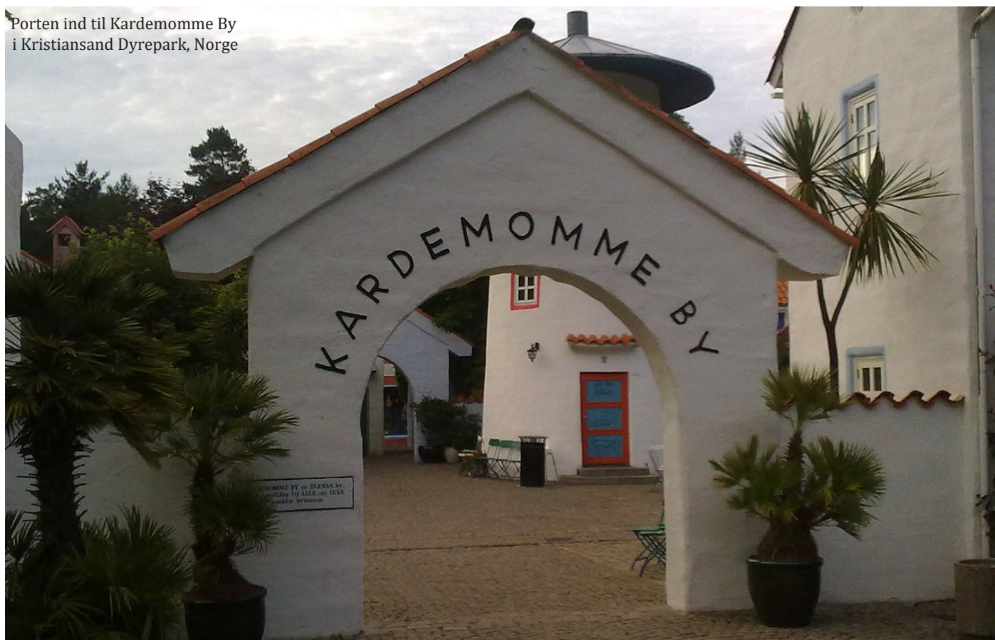
Porten ind til Kardemomme By i Kristiansand Dyrepark, Norge

Til sidst redder de byen ved at slukke ilden i tårnet, hvor ingen andre tør klatre op. Derfor bliver de sat fri og får alle gode job i byen og freden er genoprettet, nu uden ufreden- røvere - lurende lige udenfor bymuren.