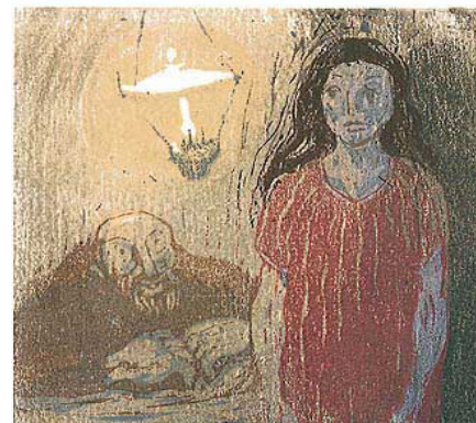
Træsnit af Th. Egner

"Det billede blev så trist, at man næsten kunne græde – og det var jo netop det det skulle være," sagde han.