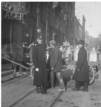
Politibetjent i Oslo i begyndelsen af 1900tallet

Som i Kardemomme By kørte der en sporvogn frem og tilbage på gaden. Kvarteret havde også sin egen politimand, Politikonstabel Hansen, der var ligeså rar som Politimester Bastian.