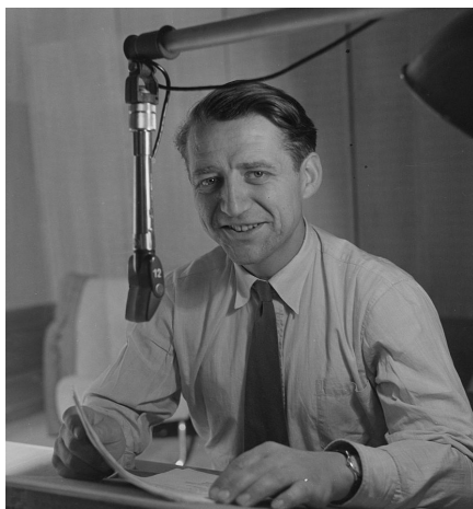
Thorbjørn Egner i radiostudiet

Egners historier var så populære, at han skrev dem om til teaterstykker og til sidst udkom de også som bøger.