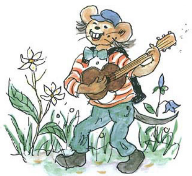
Tegning af Thorbjørn Egner