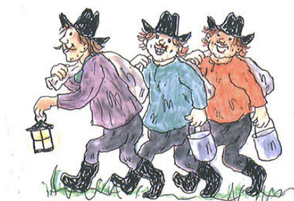
Tegning af Thorbjørn Egner

Hvis I har lyst, kan I vælge at kopiere teknikken fra bøgerne: Tegn med med blyant først. Tegn så stregerne op med vandfast tusch og visk blyanten ud. Farvelæg med vandfarve eller akvarelfarveblyanter.