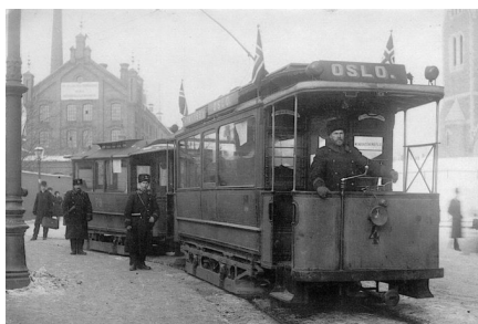
Sporvogn i Oslo i begyndelsen af 1900tallet

Thorbjørn Egner voksede op i et arbejderkvarter i Oslo, hvor hans forældre havde en lille købmandsbutik. Kvarteret minder meget om Kardemomme By. Ved siden af forældrenes købmandsbutik lå en slagter og en bager. Det er derfor næppe et tilfælde, at det netop er købmanden, slagteren og bageren, der fanger røverne i historien.