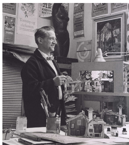
Egner i sit arbejdsværelse med en pensel i hånden og med modeller af husene

Der var også hver uge en bunden opgave f.eks. Tegn en ulykke eller tegn et sommerbillede.