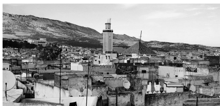
Medinaen i Fez 2016